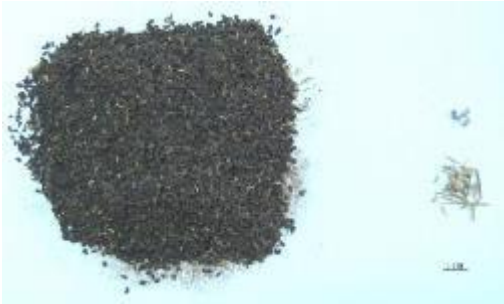
Şekil 9. Üzerlik örnekleri (P5) ve yabancı madde içerikleri