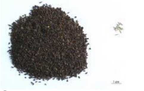
Şekil 5. Üzerlik örnekleri (P1) ve yabancı madde içerikleri