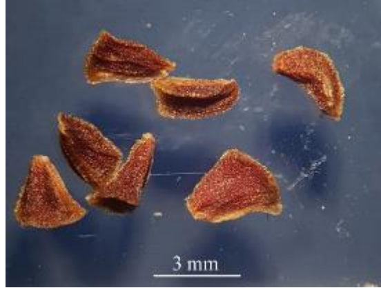
Şekil 4. Peganum harmala tohumu

Piyasadan satın aldığımız 10 farklı numunenin incelenmesi ile elde edilen morfolojik özellikler Tablo 2 ve Şekil 5-14'te verilmiştir.