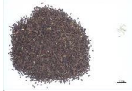
Şekil 6. Üzerlik örnekleri (P2) ve yabancı madde içerikleri