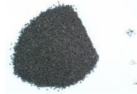
Şekil 8. Üzerlik örnekleri (P4) ve yabancı madde içerikleri