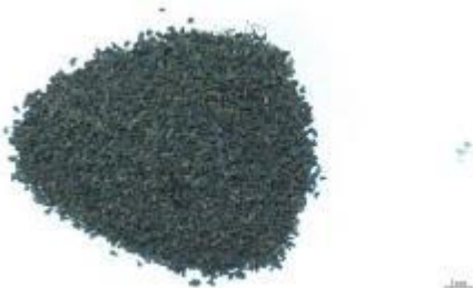
Şekil 13. Üzerlik örnekleri (P9) ve yabancı madde içerikleri