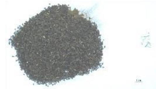
Şekil 10. Üzerlik örnekleri (P6) ve yabancı madde içerikleri