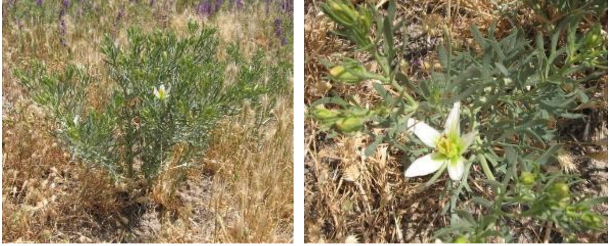
A Şekil 1. Peganum harmala A- Genel görünüşü; B- Çiçekli bitki

yaprakları 3-5 cm uzunluğunda, alternat, çok küçük düşücü stipulalıdır. Yaprak düzensiz bir şekilde linear, lanseolat ya da dar eliptik parçalara bölünmüştür, çoğunlukla tabanda üç parçalıdır. Çiçekleri sapsız, genellikle yaprak ile karşılıklı konumlanır. Sepaller linear, yeşil, yaprak parçalarına benzeyen ve çoğunlukla düzensiz parçalanmıştır. Çok küçük epikaliks taşır. Petaller beyaz, eliptik, 10-13(-19) mm, genellikle sepalleri biraz geçer. Meyve kısa saplı, genişçe obovoid ya da küremsi, 8x8 mm boyutunda, lokulisit bir kapsüldür [3] (Şekil 1).