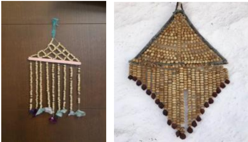
Şekil 2. Nazarlık olarak kullanılan Peganum harmala meyveleri

Ülkemizde halk geleneksel olarak, Adana'da bitkinin tohumlarını [6], Midyat (Mardin)'ta çiçek ve tohumlarını [7], Afyonkarahisar'da herbasını [8], Uşak'ta meyveli dallarını [9], Kars'ta çiçek, dal ve meyvelerini [10], Sivas ve Yozgat'ta meyvelerini [11] duvara asarak nazarlık olarak kullanılmaktadır (Şekil 2). Ayrıca Uşak'ta meyveli dalları [9], Yahyalı (Kayseri) ve Tarsus (Mersin)'da tohumları [12] yakılarak tütsü şeklinde nazara karşı kullanılmaktadır.