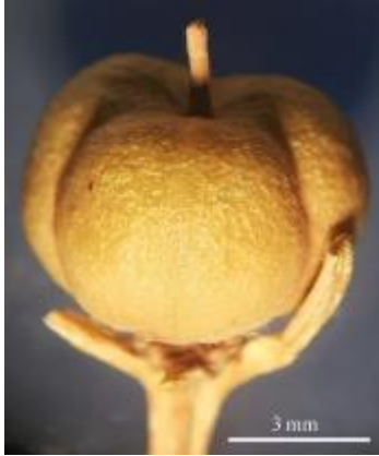
Şekil 3. Peganum harmala meyvesi

Haymana'dan toplanan ve standart örnek olarak kullanılan meyveler, koyu sarı-açık turuncu renkli, 7-12 mm çapında, küremsi, lokulisit bir kapsüldür. Kapsül 3 parçalı olup, karpel izleri dışarıdan girinti yapmıştır. Meyve tabanında kaliks (çanak yaprak), tepesinde ise stilus (boyuncuk) kalıntısı taşır (Şekil 3). Tohum çok sayıda, açılı, genellikle üçgen şekilli, koyu kahverengi-siyah renkli, yüzeyi pürüzlü, kenarları ise sarımsı renkli, 3-4 mm uzunluğunda, 0.5-1.5 mm genişliğindedir (Şekil 4).