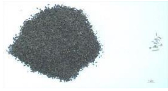
Şekil 12. Üzerlik örnekleri (P8) ve yabancı madde içerikleri