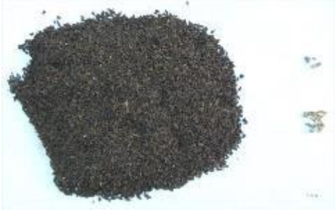
Şekil 7. Üzerlik örnekleri (P3) ve yabancı madde içerikleri