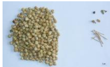
Şekil 14. Üzerlik örnekleri (P10) ve yabancı madde içerikleri