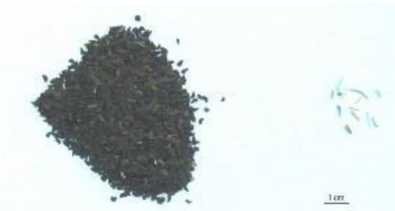
Şekil 11. Üzerlik örnekleri (P7) ve yabancı madde içerikleri