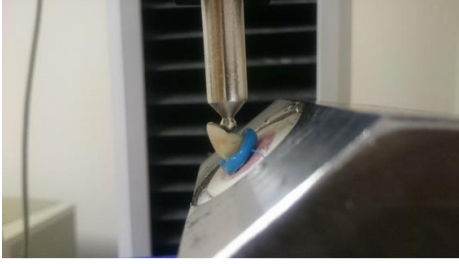
Şekil 3. Test makinesinin ucu dişin uzun aksıyla 135 derece açı yapacak şekilde yerleştirildi

Kron travmasını taklit etmek amacıyla dişlerin mine-sement birleşim hattının 3mm üst bölgesinden kronun palatinalinden, 1mm/dk hızında kuvvet uygulanmıştır 5 . Dişlerde kırılma gerçekleştiğinde test makinesi durdurularak ekrandaki değerler Newton cinsinden kaydedildi.