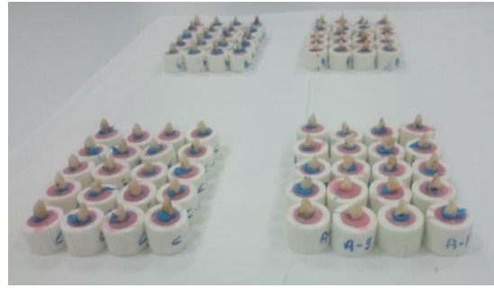
Şekil 2. Plastik kalıplara yerleştirilmiş 80 adet diş

Şekil 2'de 80 adet diş kırma deneyi için 20 mm çapında ve 20 mm yüksekliğinde hazırlanmış plastik silindirik kalıplar içerisinde akrilik rezine gömüldü (Şekil 2).