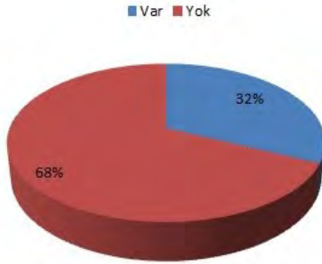
Şekil 3: Tütün ürünü kullanmayanlarda, sağlık çalışanı olmanın etkisi

64(%17) kişi sağlık çalışanı olmasının tütün ürününü kullanmama sebebi olduğunu belirtti ( Şekil 3 ). Tütün ürünü kullanmayanların 54(%26)'ü, tütün ürünü kullanmayı denemeyi düşündüklerini belirttiler. Tütün ürünü kullanmayan 201 kişinin 150(%75)'si pasif maruziyetleri olduğunu belirtti.