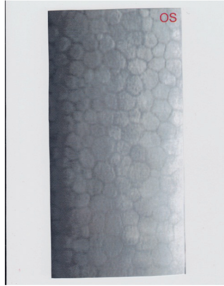
Resim 2: İlk olgunun kornea endotel hücre yoğunluğunu gösteren spekül mikroskopi görüntüsü.

ler mikroskopide polimegatizm, polimorfizm ve korneal endotel hücre sayısının 1500/ mm 2 olduğu görülmüştür ( Resim 2 ). Santral kornea kalınlığı ise aynı göz de 547 mikron olarak ölçülmüştür. Ameliyat sonrası ikinci haftada ön kamaraya lavajı yapılarak perflorodekalin uzaklaştırılmıştır. Bir hafta sonraki kontrolde kornea