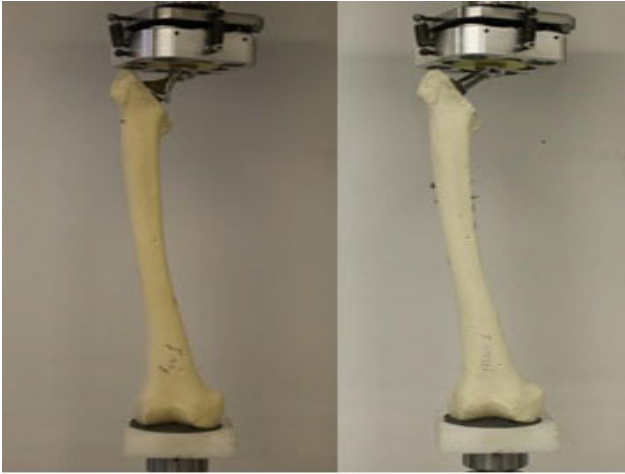
Şekil 1: Test düzeneği